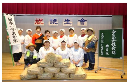
今吉田女性会様 (10月19日)