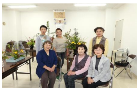
浄円寺仏婦様 (10月21日)