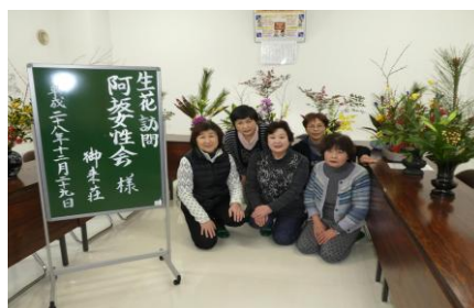
阿坂女性会様 (12月29日)