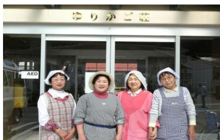
シルバーボランティア様 (10月15日)